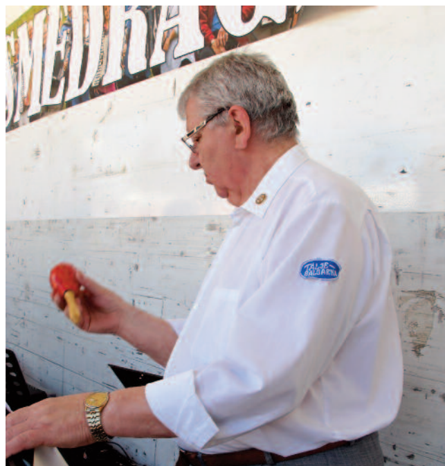
Små rytminstrument "Täljebälgarna"

Så visst är en dragspelsstämma precis som livet själv – enfald blir tråkigt men mångfald spännande. Det rymms många varianter inom god musik och framförallt i vår härliga dragspelmusik eller rättare sagt musik på dragspel. Så alla ni som INTE spelar dragspel, öva flitigt på era olika instrument och kom till Eskilstuna nästa år och delta i vårt tjuogoårsjubileum!