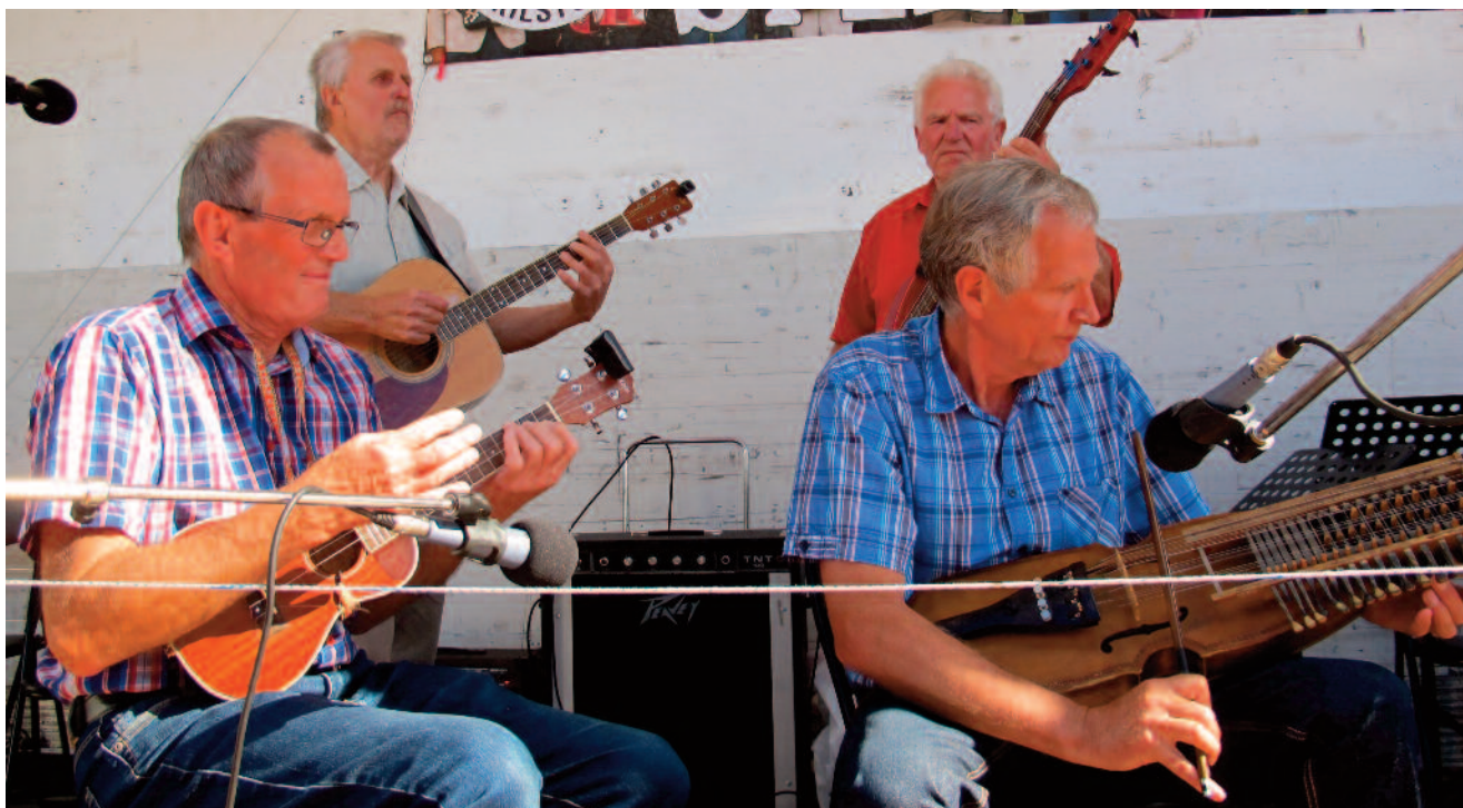
Nyckelharpa, ukulele, gitarr och elbas Bjursås dragspelsklubb