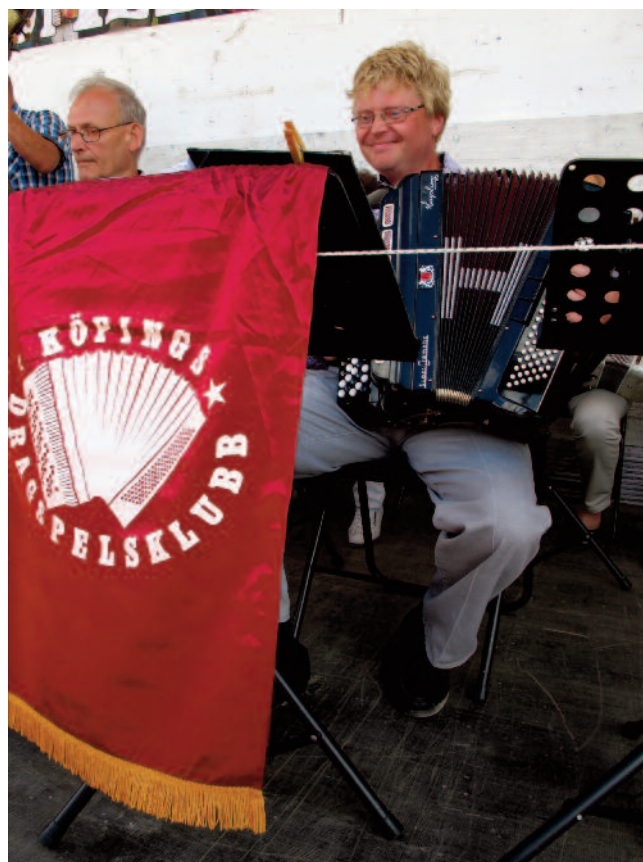
Stort dragspel förstås